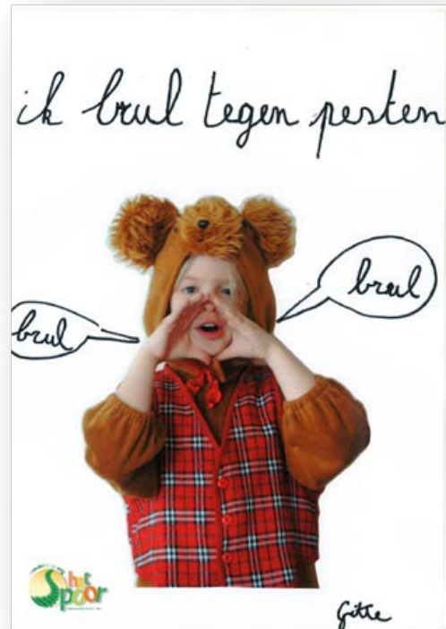
Gitte Derammelaere uit L3